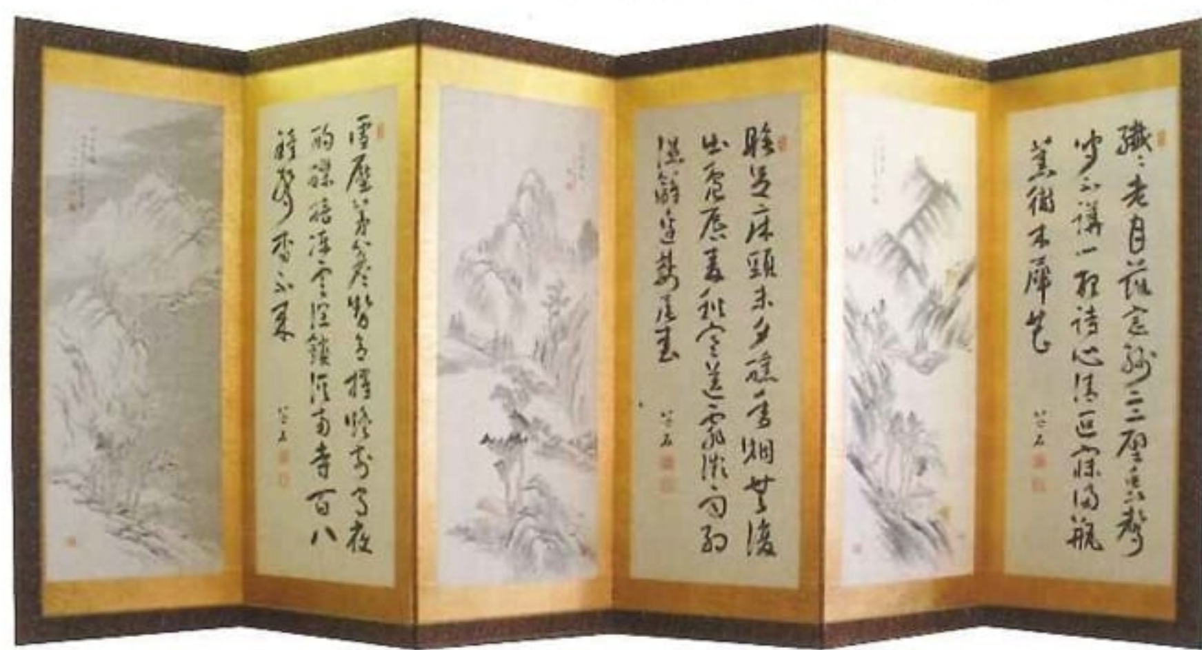
まさのしせき 牧野芝石「四季」六曲一双(鳥取市鹿野町総合支所所蔵)