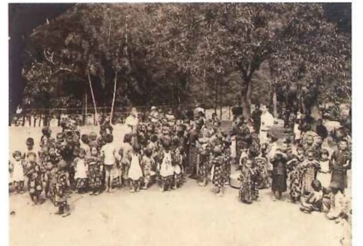
河内での託児所風景