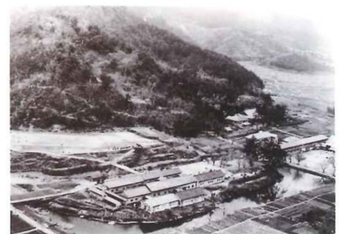
鹿野城跡と旧鹿野町役場