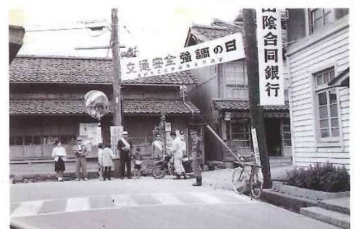
山根町での街頭指導(昭和42年頃)