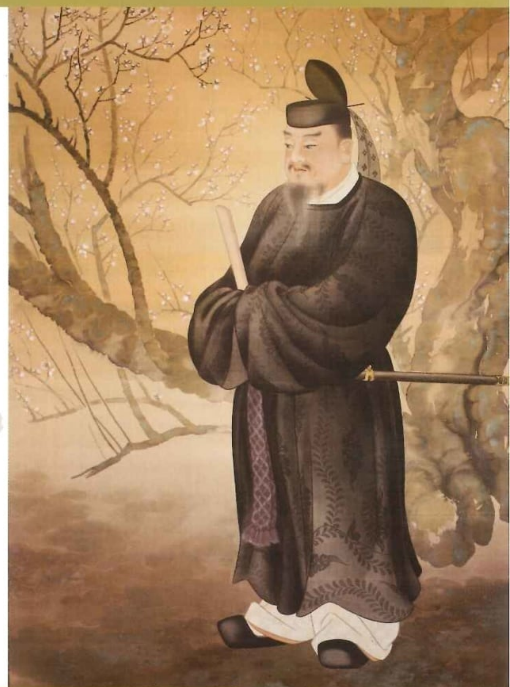
【鳥取市指定保護文化財】井江耕宗「名和長年公絵」(左)、「菅原道真公絵」(右) (いずれも鳥取市立鹿野学園所蔵)

休館日 2/25(月)、3/4(月)・11(月)・18(月)・22(金) 開館時間 午前9時～午後5時